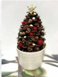
①松ぼっくりツリー作品例 (高さ約15cm)