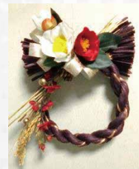
③和モダンしめ縄 スワッグタイプ作品例