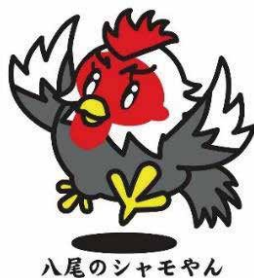
八尾のシャモヤン