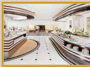
宝塚ホテルビュッフェ&カフェレストラン アンサンブル

宝塚歌劇百周年記念奉舞 『宝塚 110年の恋のうた』 作・演出/大野 拓史 ジャズ・スラップスティック 『Razzle Dazzle (ラズル ダズル)』 作・演出/田淵 大輔