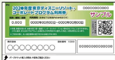
コーポレートプログラム利用券

東京ディズニーランド®/東京ディズニーシー®のパークチケットの 購入やディズニーホテル宿泊にご利用いただける利用券です。