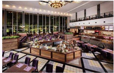
料理写真はイメージです